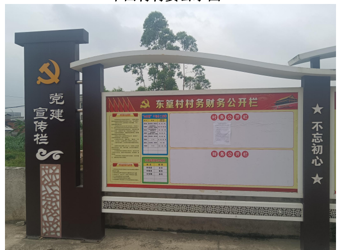
东篁村村委公示图 2