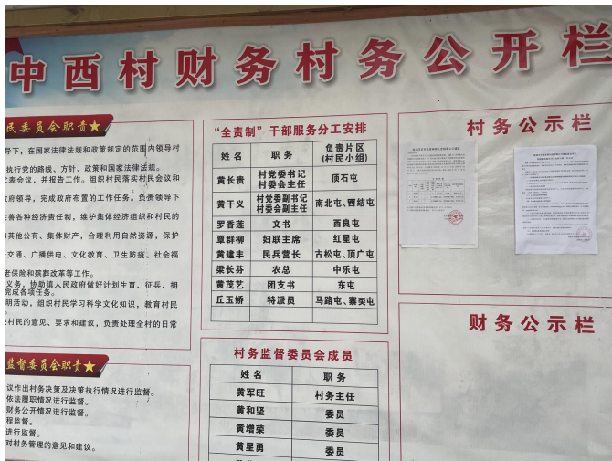
中西村村委公示图 1

本项目的的环境影响报告书征求意见稿形成后，我单位于 2026 年 3 月 2 日在周边村屯、项目场地张贴第二次公示，符合《环境影响评价公众参与办法》（生态环境部令第 4 号）的要求，现场张贴公示的照片见图 3-4。