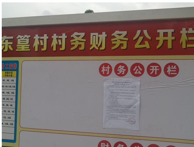
东篁村村委公示图 1