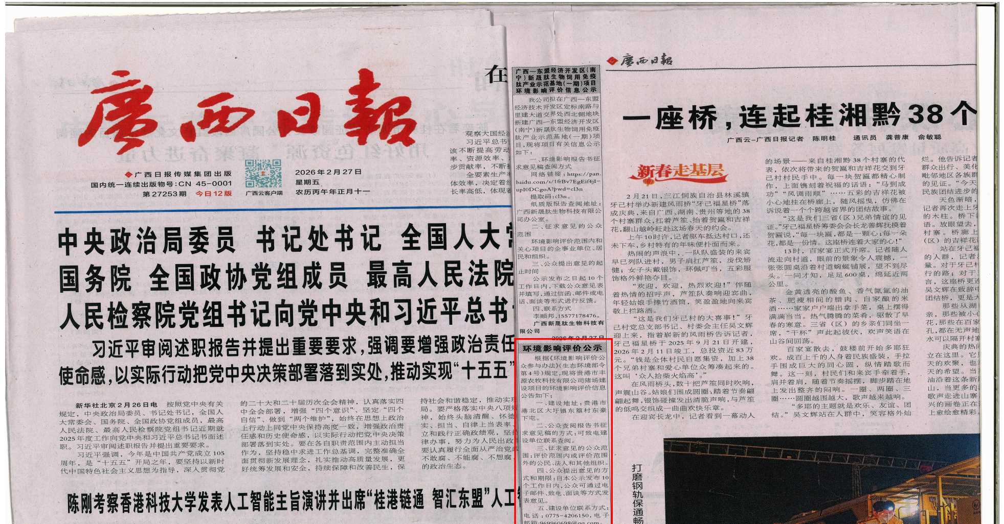
图 3-2 第二次公示——报纸公示照片（2026年2月27日广西日报）

本项目的环境影响报告书征求意见稿形成后，我单位于2026年2月27日和2026年2月28日在广西日报发布了第二次公示，符合《环境影响评价公众参与办法》（生态环境部令第4号）的要求，报纸公示的照片见图3-2和图3-3。