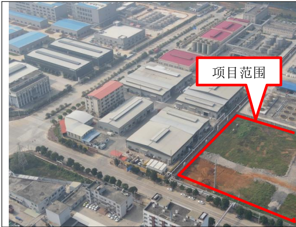
项目东面-广西恒丰化工有限公司