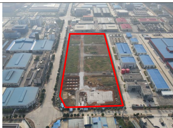
项目区现状 2 (2025.10.16)