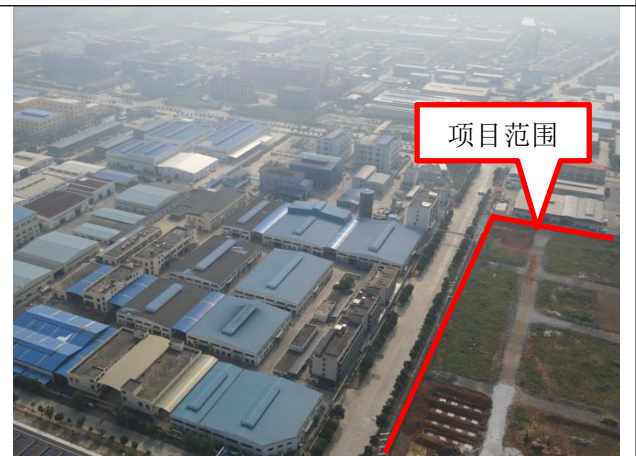
项目北面-广西利民药业股份有限公司