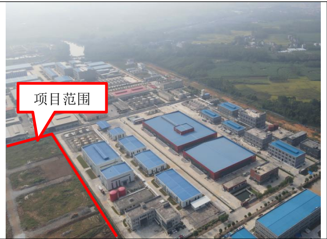
项目南面-广西苏博特新材料科技有限公司