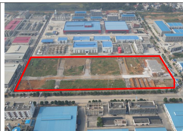
项目区现状 1 (2025.10.16)