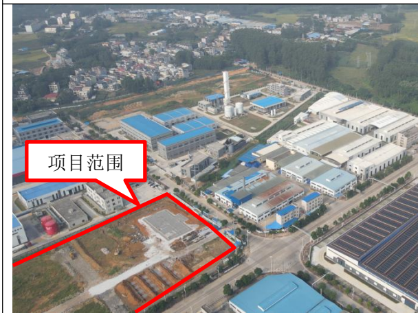
项目西面-广西金土地盛大生物科技有限公司